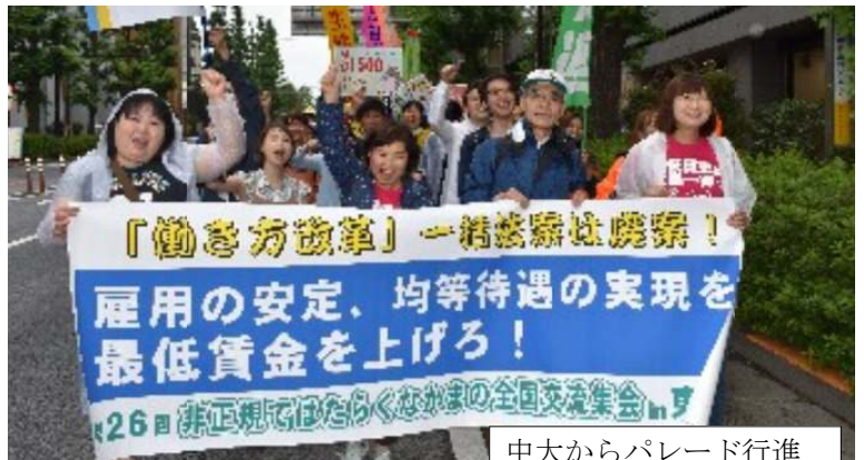
中大からパレード行進