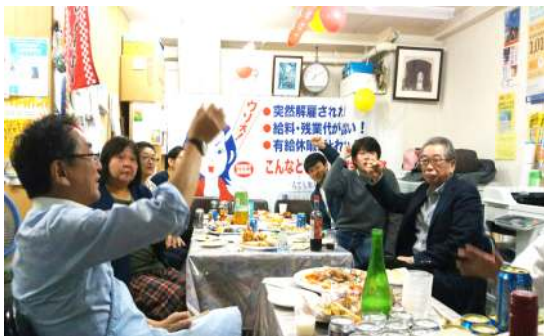
文京支部 第2回「わかもの食堂」