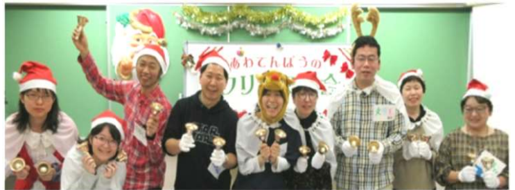
CU渋谷 「あわてんぼうのクリスマス」(4面)

にに取り組んできたことの結果です。「労働相談活動はCU東京へ」の声は確実に広がりました。