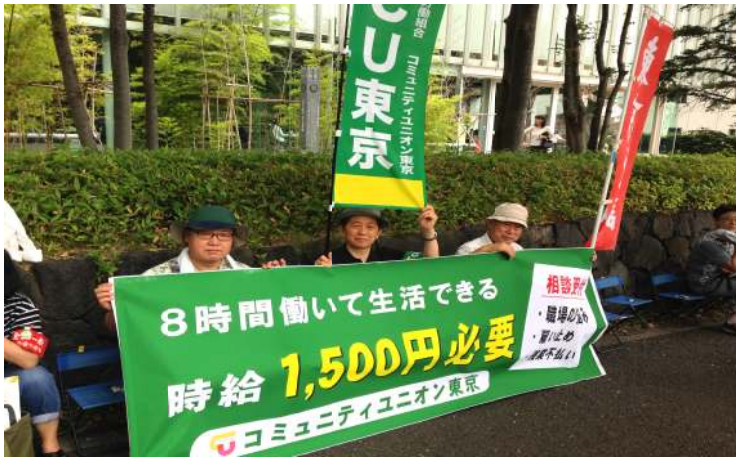
7/30 東京労働局前 座り込み行動