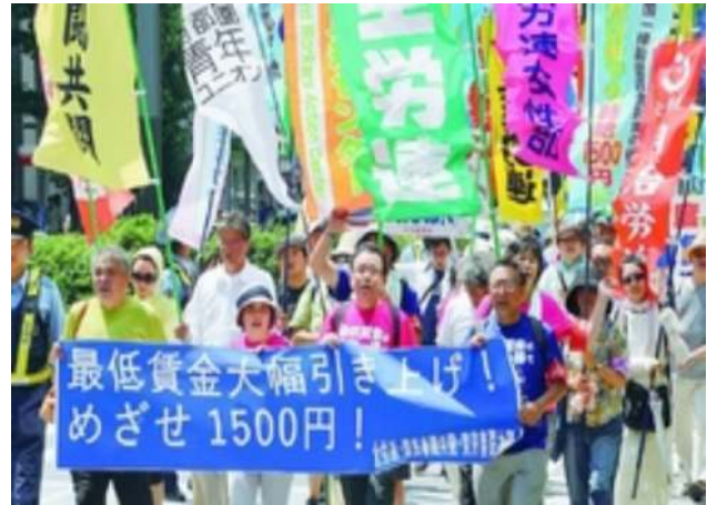
7/15 全労連・春闘共闘の最賃引き上げサウンドデモ