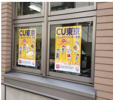
事務所の入口が通路側ですのでポスターが目印になっています。お立ち寄りください。

本部のある東京労働会館の窓に張り出しました。外から覗かれる方います。また、一緒に作った腕章も目だっていいと好評です。