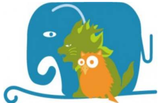
ユニオンちよだのホームページのキャラクターゼビ、開いてみてください。

『お忙しいところ、早速ご親切な返事大変感動いたします。千代田区、日本国内にユニオンちよだの皆様のような親切、且つ正義な人間がいるからこそ私は大変助けられると感じ、これから日本の社会に貢献できますように頑張っていくと思ひます。ひきつづきどうぞよろしくお願い申し上げます。』